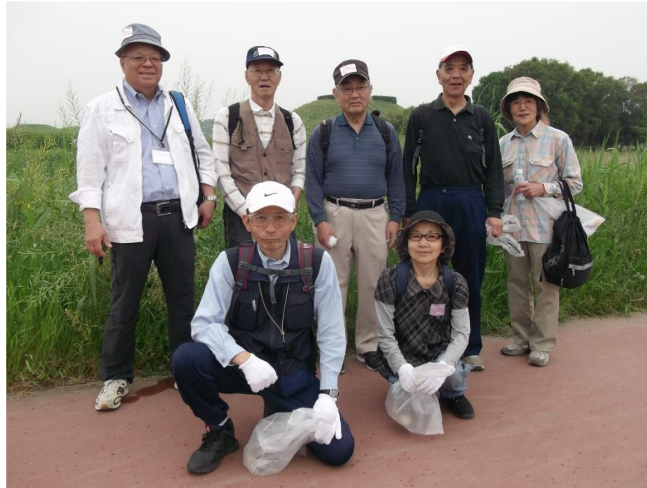
旧忍川ポタリングロードにて

市民大学5期生環境グループは、卒業後も研究を継続するべく、新たに「忍川の自然に親しむ会」として発足。この会として初めてこの大きな企画に参加した。